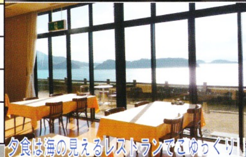
夕食は海が見えるレストランでさゆり