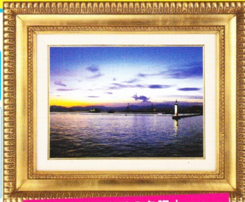
「帰るまでの夕陽」 船から見る風景100選でベストショット賞に選ばれました。