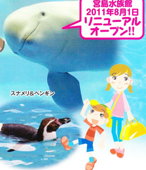
スナメリ&ペンギン